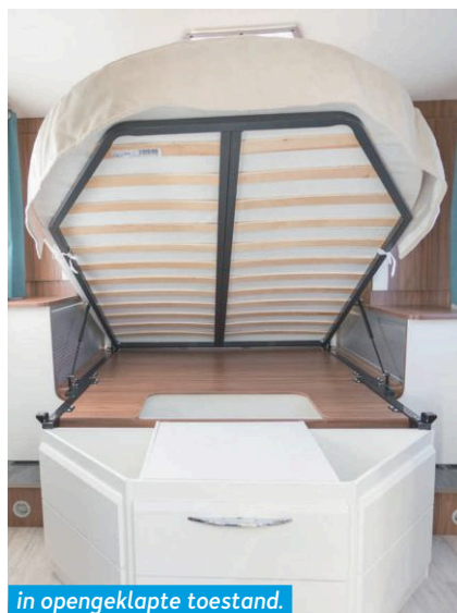
in opengeklapte toestand.