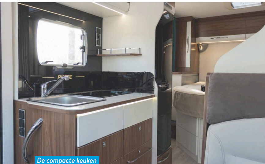
De compacte keuken heeft twee gaspitten.