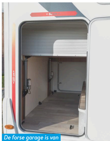
De forse garage is van twee kanten toegankelijk.