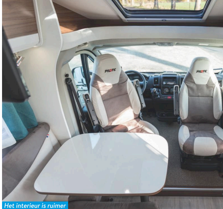
Het interieur is ruimer dan je zou verwachten.

ramen. De wanden zijn bij het dak afgewerkt met kunststof hoeklijsten.