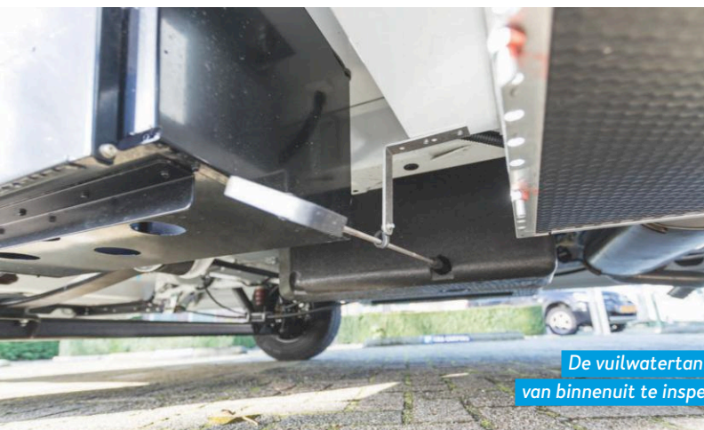
De vuilwatertank is ook van binnenuit te inspecteren.